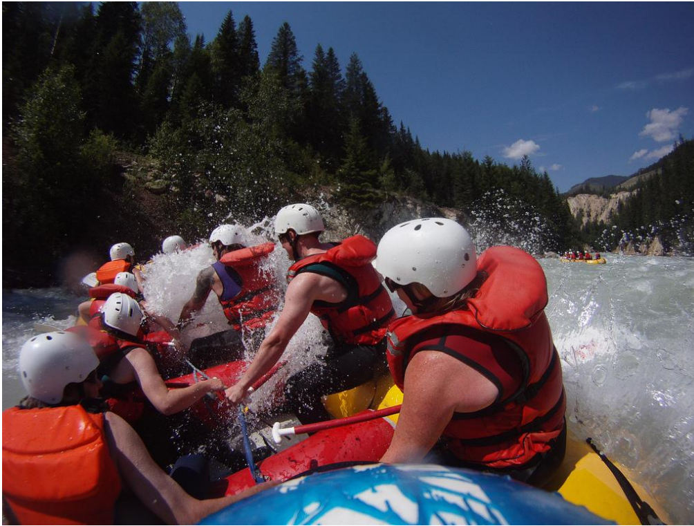
Crédit photo : Golden Adventures Rafting sur la rivière Kicking Horse